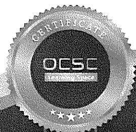
(นายปิยวัฒน์ ศิวรักษ์) เลขาธิการคณะกรรมการข้าราชการพลเรือน

[รวมระยะเวลาทั้งสิ้น 3 ชั่วโมง] ให้ไว้ ณ วันที่ 13 กรกฎาคม พ.ศ. 2566